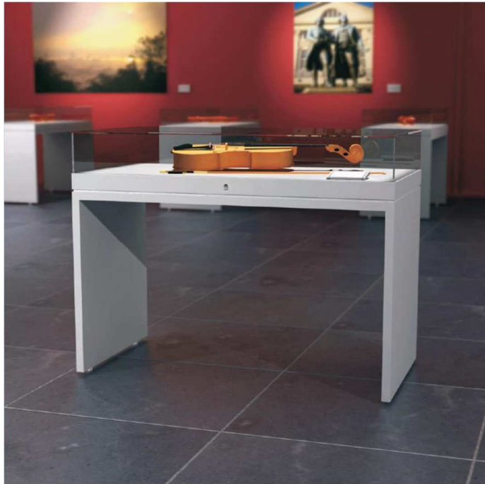
Table Cases 1/2