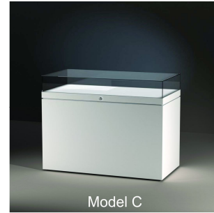
Model C Ganzglas-Tischvitrine mit flächenbündigem Sockelunterbau Table Case with full base