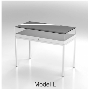
Model L Ganzglas-Tischvitrine mit 4 Tischbeinen Table Case with 4 legs